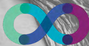
Table de concertation des groupes de femmes de la Montérégie