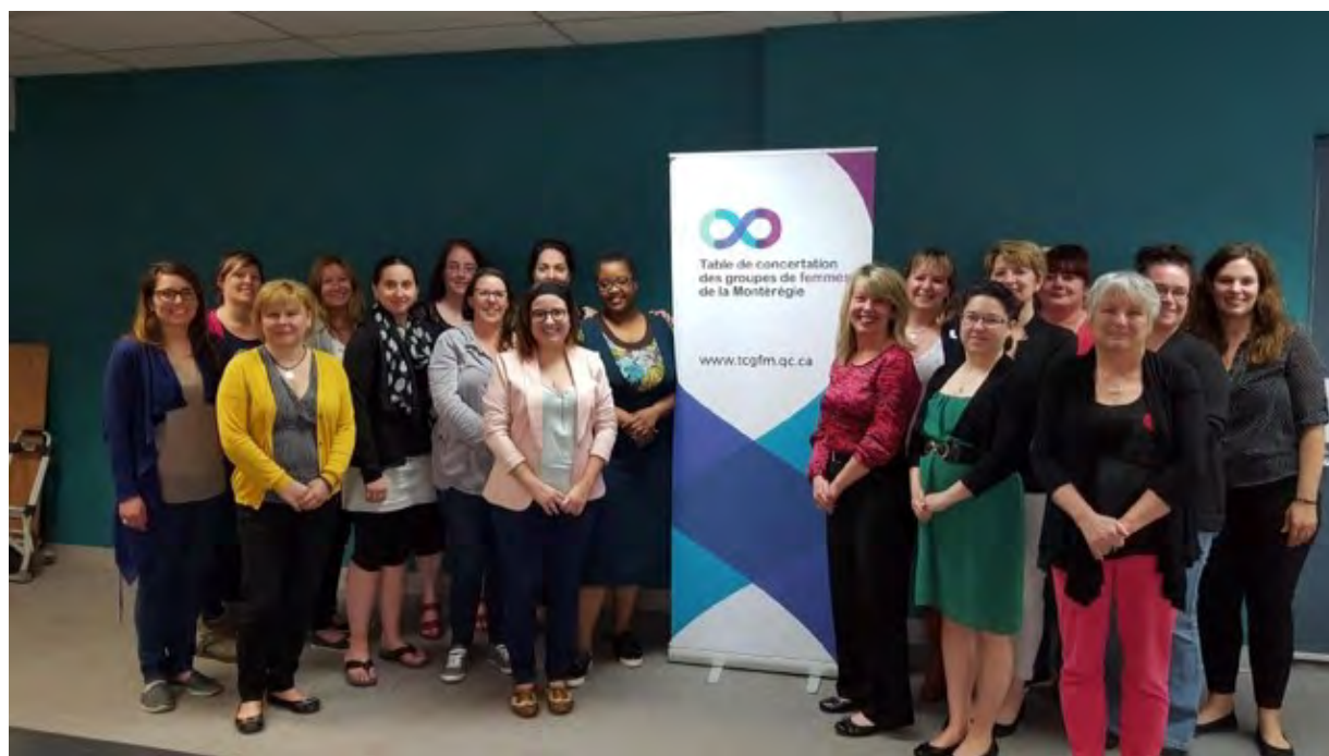
Lancement du projet : Plus de femmes en politique? Les médias et les instances municipales, des acteurs clés! , 31 mai 2017

En 2016, Condition féminine Canada a lancé un appel de propositions : Soutenir l'autonomie des femmes et la TCGFM a décidé de déposer un projet dans le cadre du volet : Outiller les femmes pour la vie politique. La TCGFM est fière d'annoncer que notre projet a été retenu et que nous avons démarré le projet triennal Plus de femmes en politique? Les médias et les instances municipales, des acteurs clés! , en mars 2017.